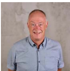
CDA B.W. Drinkwaard