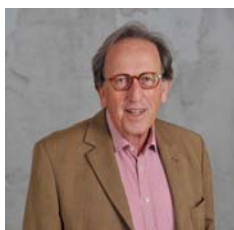
GemeenteBelangen G. Diemer