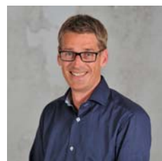
GemeenteBelangen R.P. Slootweg