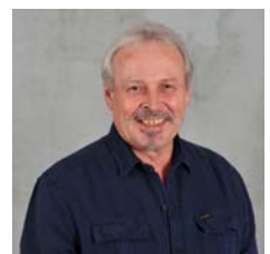
Hart Voor Katwijk A. Oosterlee