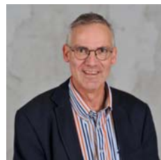
De Lokalen G.H.A. Bol