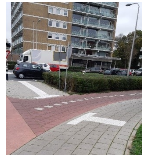
Geleidelijnen en noppentegels bij de oversteek van het fietspad