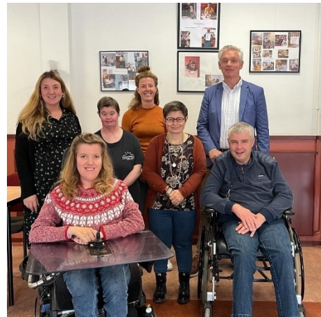
Wethouder E. Soetendal op werkbezoek bij Binders

Daarnaast heeft wethouder Emile Soetendal in de Week van de Toegankelijkheid een werkbezoek gebracht aan Binders. Bij Binders worden inwoners met een afstand tot de samenleving geholpen en begeleid om (weer) meer deel te kunnen nemen.