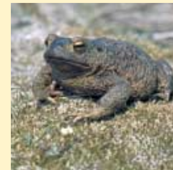
Gewone pad (Rein van Rossum)

Door herinrichting van het gebied moet een deel van het oude duinlandschap terugkeren met bloemrijke duingraslanden, duinstruweelen, paddepoelen en duinbeekjes.