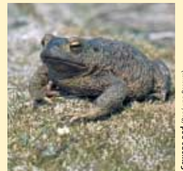
Gewone pad (Rein van Rossum)

Door herinrichting van het gebied moet een deel van het oude duinlandschap terugkeren met bloemrijke duingraslanden, duinstruweelen, paddepoelen en duinbeekjes.